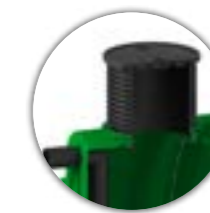
REVIZIJA IZNAD ULAZA I IZLAZA DN 600