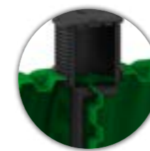
REVIZIJA iznad pregradne stene zbog dostupanja u sve komore