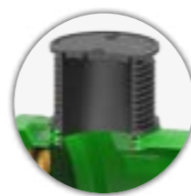
DODATNA REVIZIJA DN 600